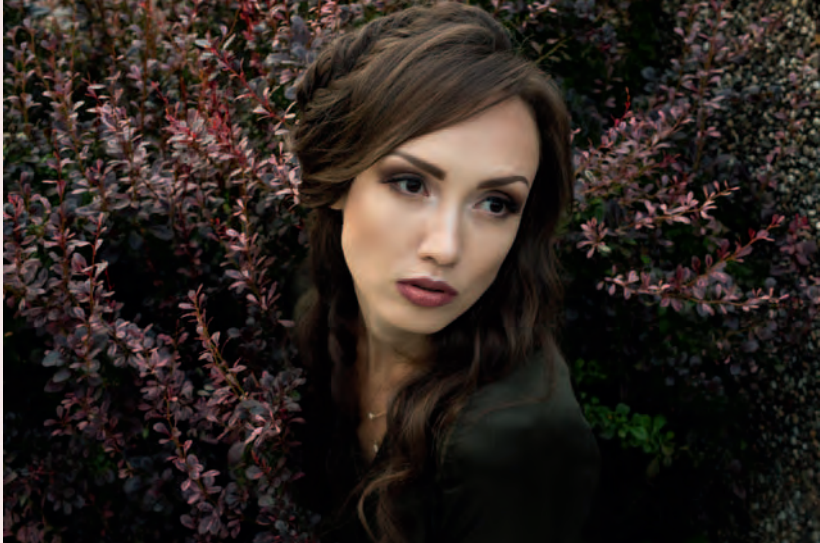
50 mm f/8.0: geschlossene Blende, großer Schärfebereich