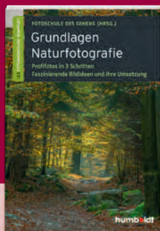
Fotoschule des Sehens (Hrsg.) Grundlagen Naturfotografie ISBN 978-3-86910-217-7