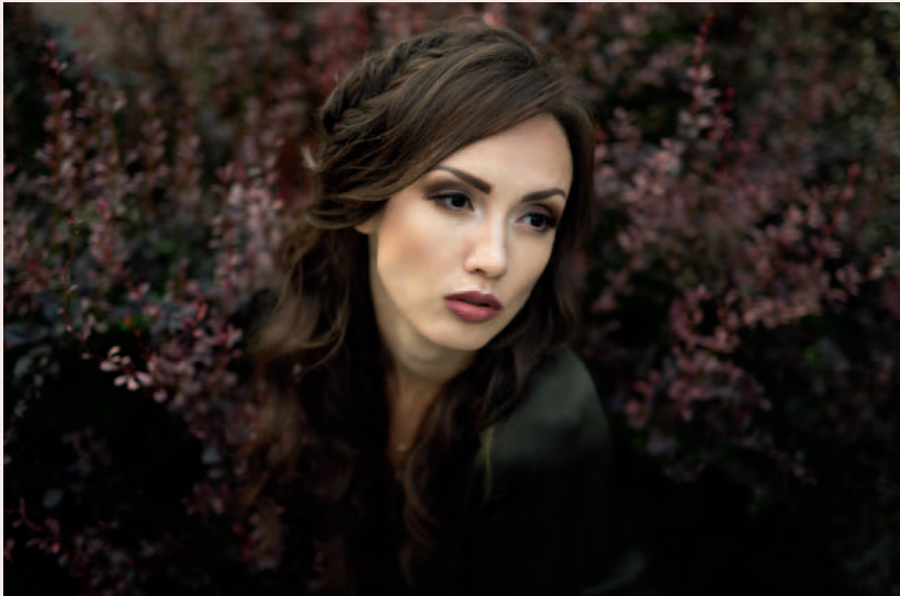
50 mm f/1.4: offene Blende, kleiner Schärfebereich