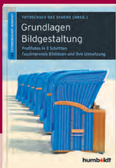
Fotoschule des Sehens (Hrsg.) Grundlagen Bildgestaltung ISBN 978-3-86910-357-0