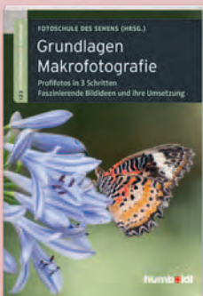
Fotoschule des Sehens (Hrsg.) Grundlagen Makrofotografie ISBN 978-3-86910-211-5