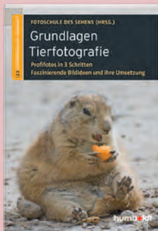
Fotoschule des Sehens (Hrsg.) Grundlagen Tierfotografie ISBN 978-3-86910-219-1