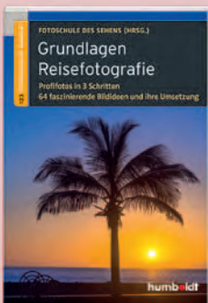
Fotoschule des Sehens (Hrsg.) Grundlagen Reisefotografie ISBN 978-3-86910-212-2