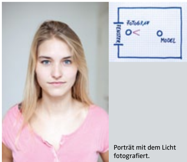
Porträt mit dem Licht fotografiert.

Um ein weiches Porträt zu erreichen, versucht man, so wenig Schatten wie möglich zu haben. Das macht man am einfachsten, indem man mit dem Licht fotografiert.