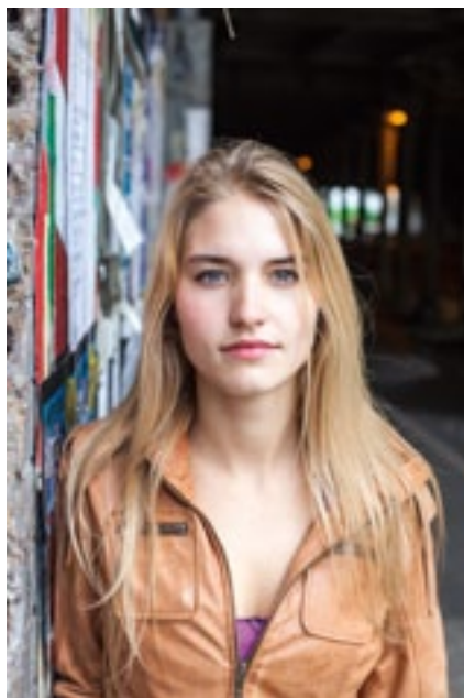
Porträt im Schatten unter einem Dach.

Oder wir suchen, wie schon im vorherigen Kapitel „Fotografieren unter freiem Himmel“ vorgeschlagen, Schatten. Am besten unter irgendeiner Art Dach, wie unter einer Brücke, in einer Hausdurchfahrt oder unter einer Bushaltestelle, da sonst das Problem mit dem Licht von oben bleibt.